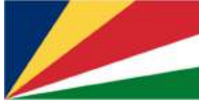
2022 MAHE / SEYCHELLES