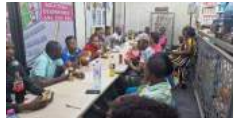
2024 YAOUNDE / DOUALA CAMEROUN